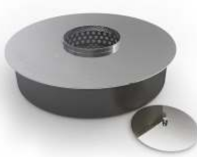
ROUND BURNER L - OS