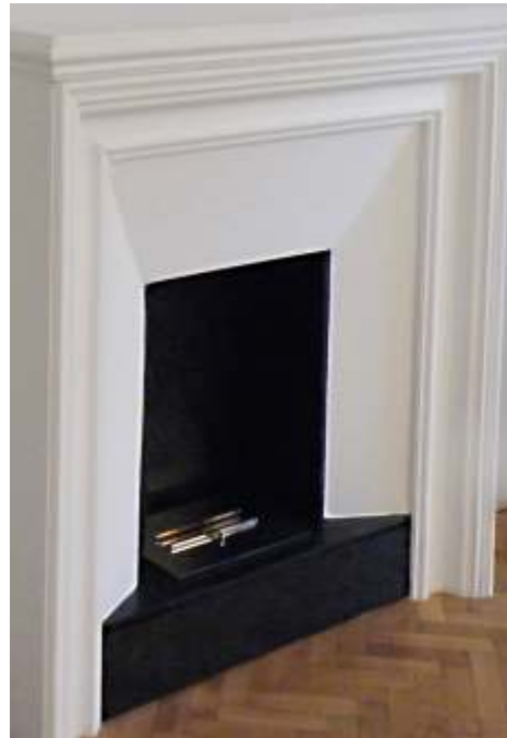
COMPACT ANDRE V and H